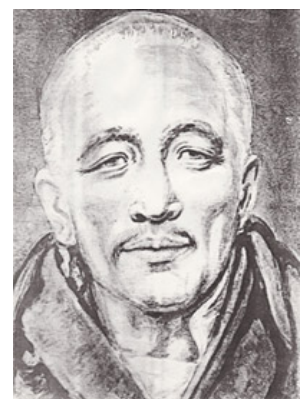
Djwal Kool, “el Tibetano”

Hace casi un siglo, Bailey empezó a transcribir las enseñanzas su maestro, Djwal Kool, “el Tibetano”. Dicho maestro le reveló la estructura de todo el universo conocido y desconocido en función de Siete Rayos de cualidades bien concretas. Dichos rayos además de estar presentes en los objetos “inanimados” también determinan los campos de tu personalidad agregada, tu campo mental, emocional y físico. Además de describir las características de estos cuatro campos, va más allá y afirma que tu Alma individual también se ve afectada por la cualidad de un rayo concreto lo cual guarda una relación directa con tu propósito individual.